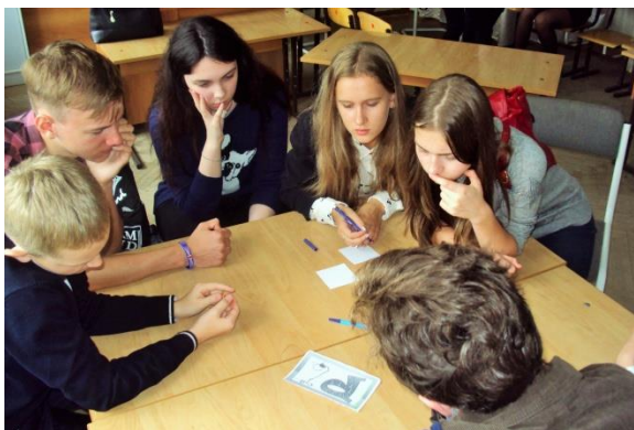
Станция «Конвейер дел»

После общего сбора, на котором прошла презентация деятельности Общероссийской общественно-государственной детско-юношеской организации «Российское движение школьников» (РДШ), все присутствующие приняли участие в игре по станциям «А ты в движении?», где глубже познакомились с направлениями деятельности РДШ и тем, как каждый может реализовать себя в Движении.