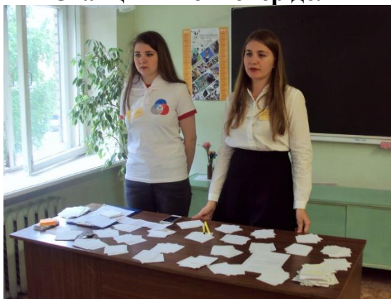
Станция «Мир вокруг нас»

В ходе «Свободного микрофона» участники секции получили ответы, на интересующие их вопросы и в первую очередь ответ на вопрос: «Что необходимо сделать, чтобы на базе своей образовательной организации создать Штаб РДШ - первичное отделение?»