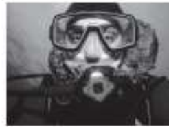
1 diving instructor

diving instructor city garden camper van painter photographer